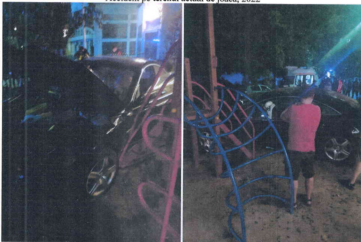
Accident pe terenul actual de joacă, 2022