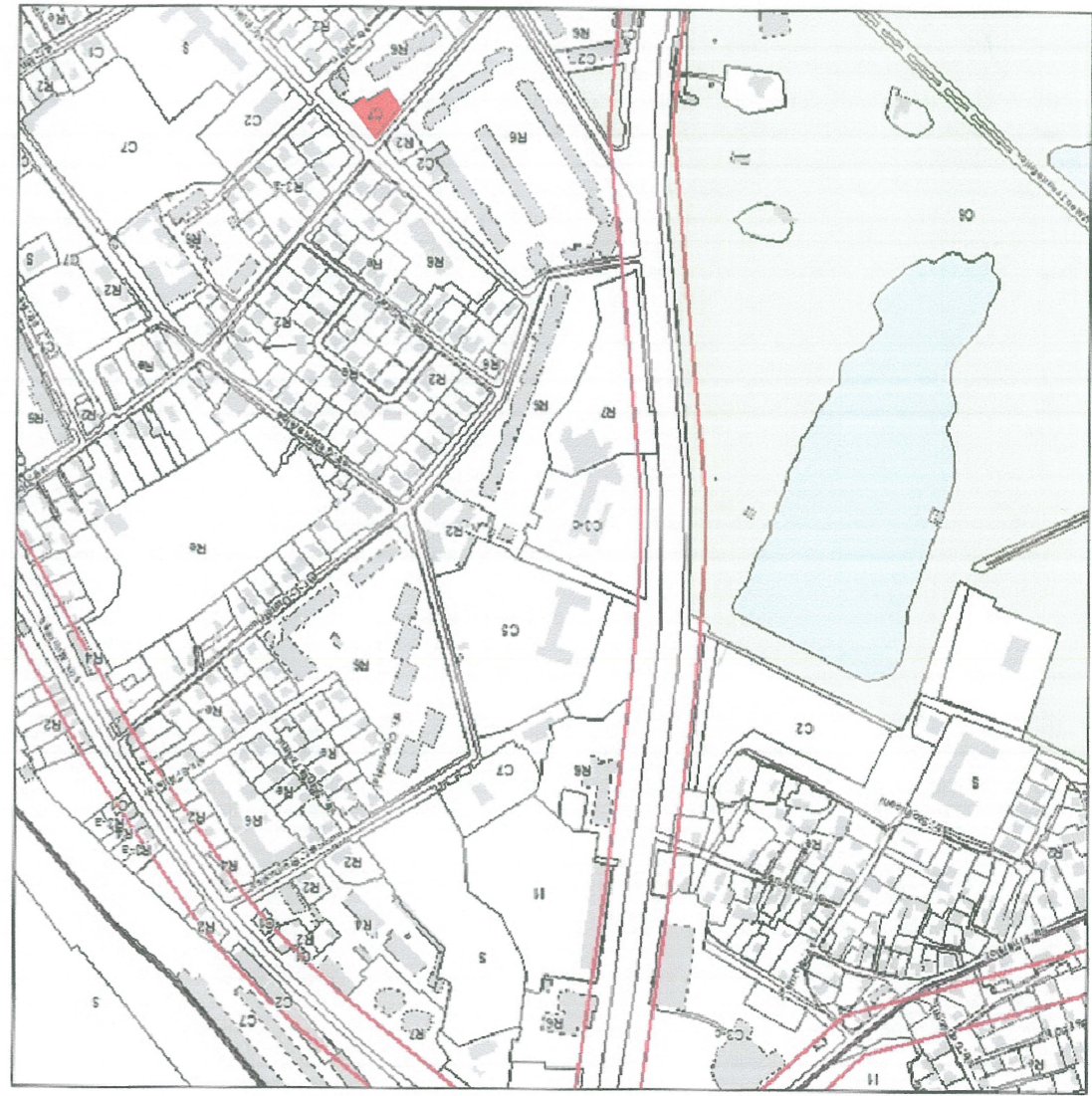
Существующий перимент. (Regulamentul Funcțional Urban). Ситуационная схема.