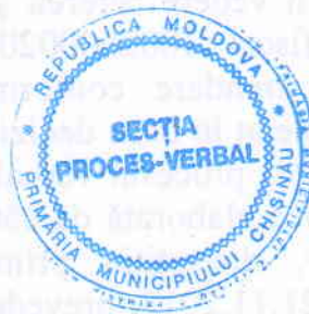
VICEPRIMAR Nistor Grozavu

5. Controlul executării prevederilor prezentei dispoziții mi-l asum.