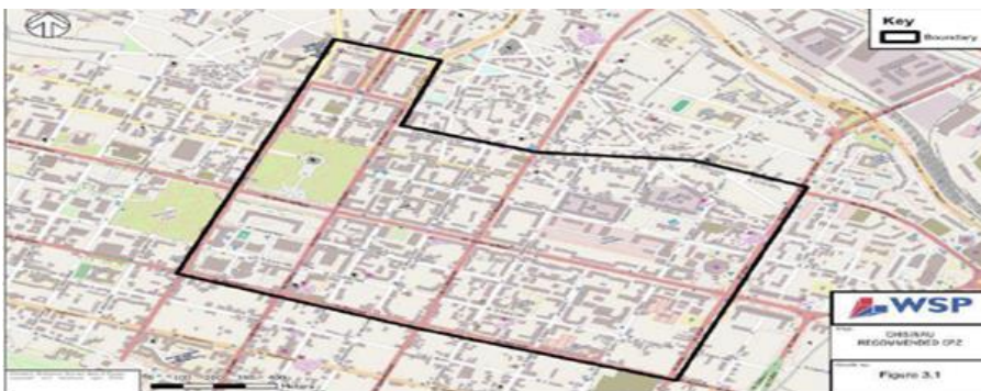
Figura 1: Zona de parcare controlată propusă.

Studiului se mai menționează, că Republica Moldova nu are în prezent propriile standarde de proiectare a autostrăzilor, ci se bazează pe utilizarea standardelor rusești, stabilite într-o serie de GOSTS și SNIPS. Prin urmare, acest ghid identifică cele mai relevante aspecte ale GOSTS și SNIPS pentru a se asigura că proiectarea străzilor și a parcarilor pe stradă se completează reciproc.