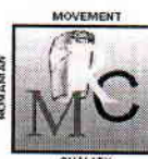
Certificat Nr.027 ISO 14001