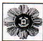
Titulară a Ordinului „Gloria Muncii”

tel. 022 25-69-01, tel/fax: 022 22-23-49 e-mail: acc@acc.md web: www.acc.md