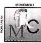
Certificat Nr.015HS OHSAS 18001