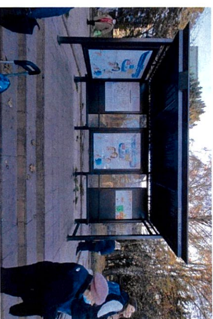
Str. Calea Leșilor lângă nr. 51/3 Parcul "La Izvor"