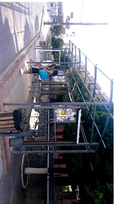
bd. Decebal, nr.2 lângă Palatul Feroviar