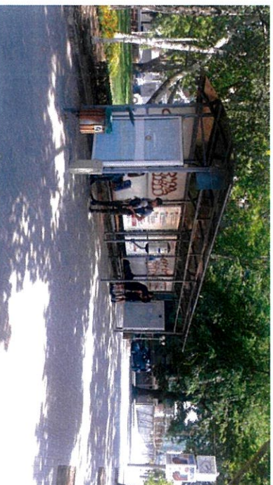
Bd. Ștefan cel Mare și Sfânt nr. 152 Teatrul de Operă și Balet