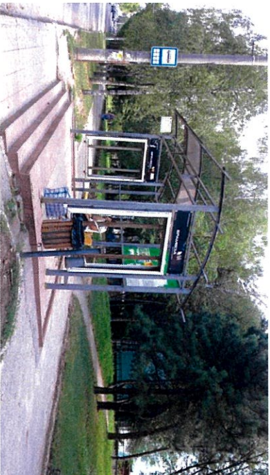
Str. Calea Leșilor lângă nr. 51/3. Parcul "La Izvor"