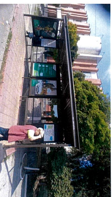
bd. Decebal, nr.2 lângă Palatul Feroviar