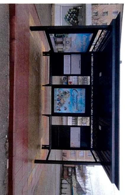
Str. Cencari colț cu str. Socoleni