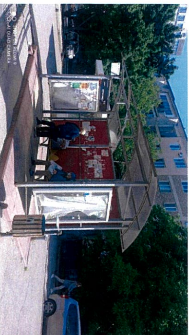
Str. Cencari colț cu str. Socoleni