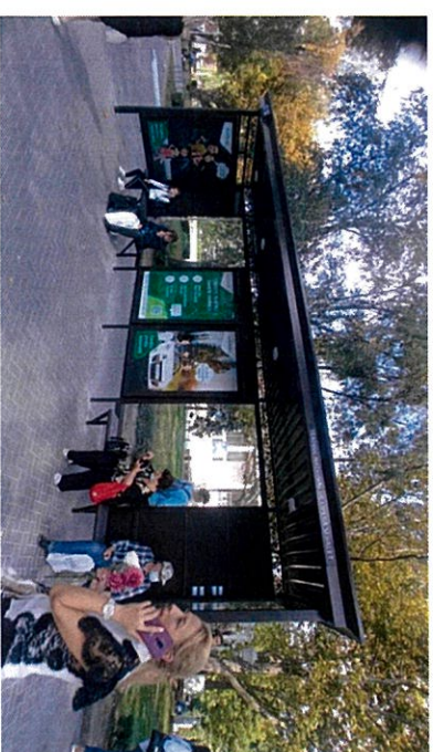
Bd. Ștefan cel Mare și Sfânt nr. 152 Teatrul de Operă și Balet

În total s-au construit și renovat 200 de stații de așteptare a transportului public.